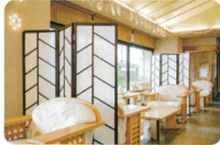
フロント・ロビー