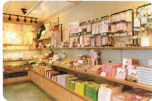
みやげ処 花ざかり